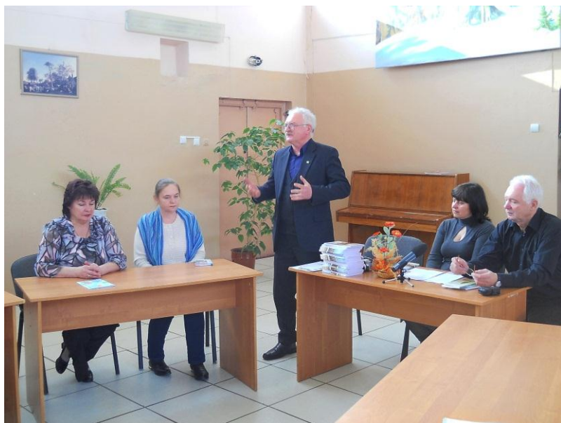
2015 р. – 15 річчя літературного об'єднання «Натхнення».