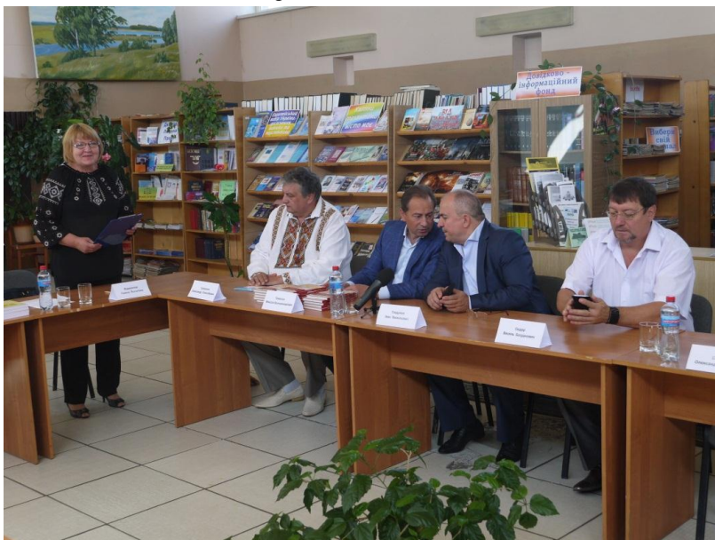
2016 р. презентація археографічного проекту з видання архівних джерел з історії Славутичини та міста Нетішина та книги М.Томенко «Україна: історія Конституції»