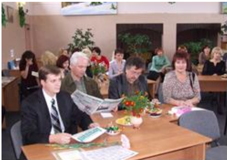
Міський конкурс юних поетів «Духовна криниця народу»