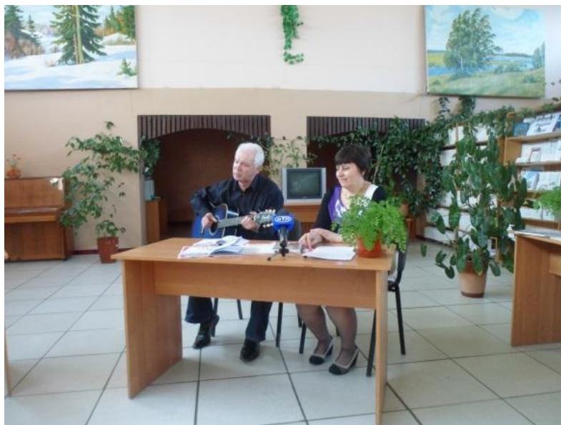
2014 р. презентація книги В.П.Гусаров «Весна прийде. По улице Высоцкого»