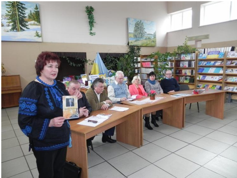
2017 р. День поезії. Презентація колективної збірки «Енциклопедія сучасної літератури»